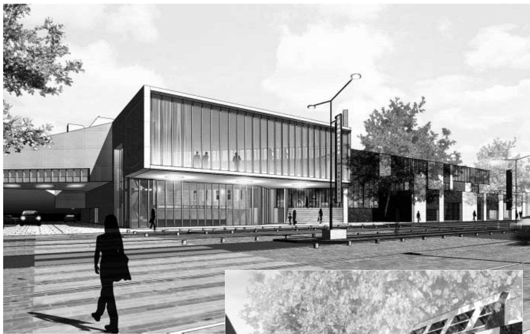
Het nieuwe glazen raadhuis (boven) gezien vanaf de Engelendaal met rechts daarnaast de gevel van het nieuwe stuk Winkelhof. Op het inzetje is het nieuwe, verdiepte (markt)plein afgebeeld.

En dan nog is niet iedereen tevreden. „Hebben Leiderdorpers ooit om deze plannen gevraagd?