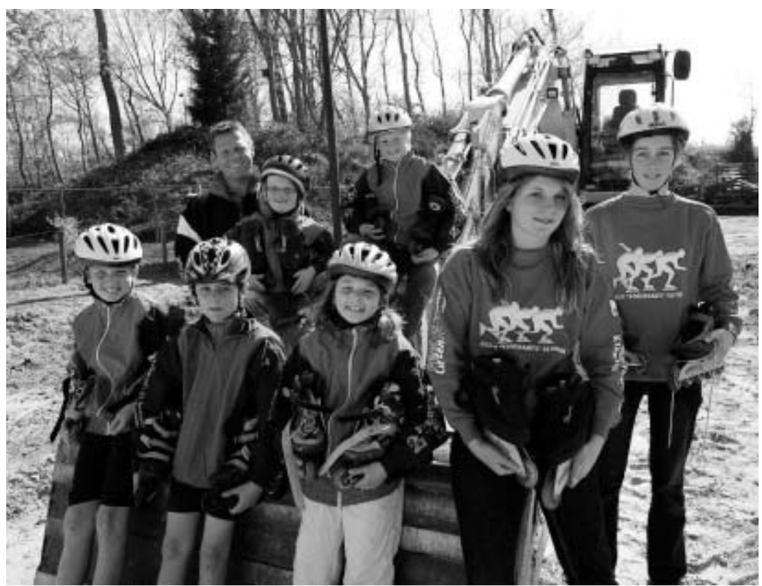
De schaatsjeugd van IJclub Voorwaarts kan niet wachten tot de skeelerbaan klaar is.

Stilletjes hoopt Van Beelen dat er een nieuwe loot aan de stam komt van de ijsclub. „Dan komt er een beetje meer reuring in de tent”, zegt Van Beelen, „dat kunnen we wel gebruiken.” Van Beelen kijkt vanuit de bestuurskamer van het clubgebouw op de Goerie. In 1991 streek de ijsclub neer op het terrein. Sindsdien is er van alles opgeknaapt, met de realisatie van het clubhuis als hoogtepunt. Het gebouw wordt gedeeld met de Stichting Sport en Recreatie Gehandicapten, die er